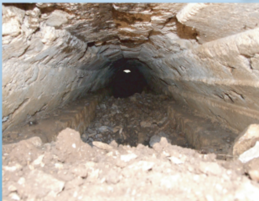
Voûte de l'aqueduc de Traslay avec les empreintes du coffrage. Cliché : Marianne Surgent, 2 septembre 2008