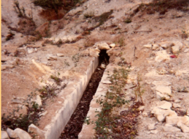
Aqueduc de la Grange Saint-Jean. Cliché : André Bernon, 03 octobre 1982

57 aqueducs ont été découverts dans le département du Cher. Les 4 plus grands alimentaient Bourges, 10 autres aqueducs alimentaient d'autres agglomérations à l'époque romaine comme Baugy, Drevant, Sancoins ou Thaumiers. 8 aqueducs alimentaient des villae et on ne connaît pas la destination des 10 derniers dont seules des sections sont connues. Tous ces aqueducs sont en cours d'étude par Marianne Surgent, dans le cadre de ses recherches scientifiques sur les aqueducs dans le Berry, durant l'Antiquité.