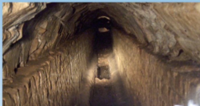
L'aqueduc de Traslay à Annoix.