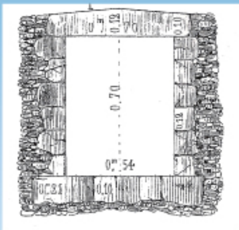
Dessin en coupe de l'aqueduc de Menetou-Salon, Octave de BARRAL, 1852, Planche 7

La ville de Bourges, appelée Avaricum à l'époque romaine, était la capitale de la cité des bituriges cubi , un des nombreux peuples de la Gaule. Quatre aqueducs se dirigeaient vers la ville et l'alimentaient en eau : ils sont appelés "Aqueduc de Traslay" (45 km de long), "Aqueduc de Menetou-Salon" (32 km), "Aqueduc de Nérigny" (7,5 km) et "Aqueduc de Valentigny" (27 km). Ils devaient aboutir à un château d'eau, puis, de plus petits aqueducs acheminaient l'eau aux différents quartiers et monuments de la ville.